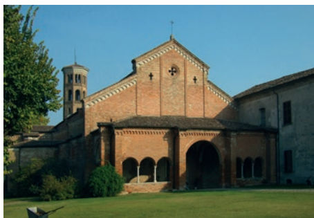
ABBAZIA CISTERCENSE · ABBADIA CERRETO