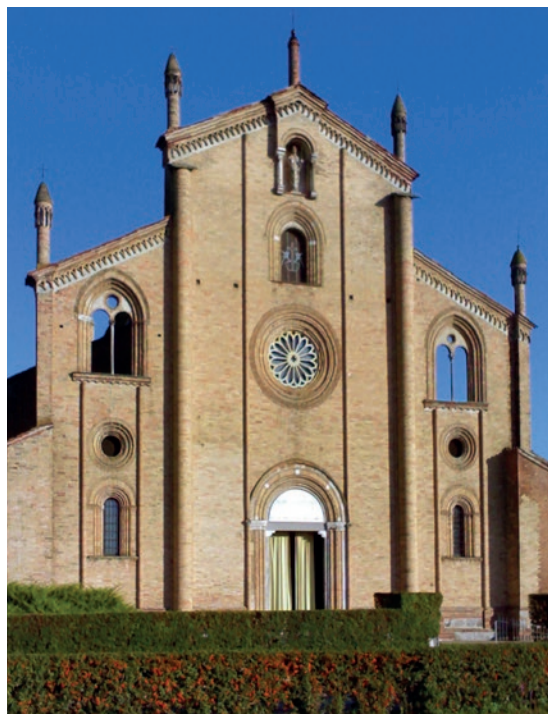
BASILICA DEI XII APOSTOLI - LODI VECCHIO