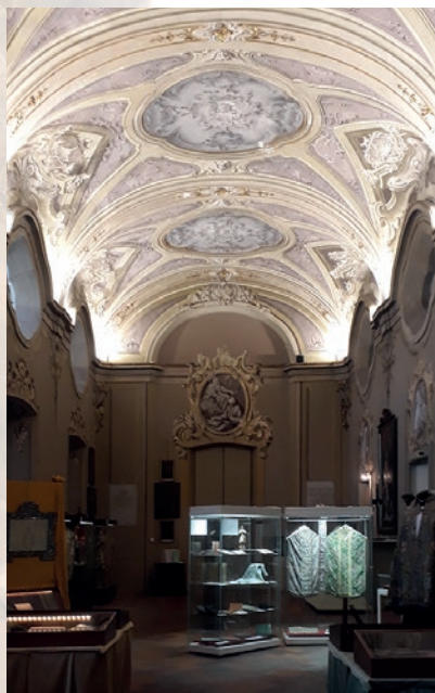
MUSEO DIOCESANO DI ARTE SACRA