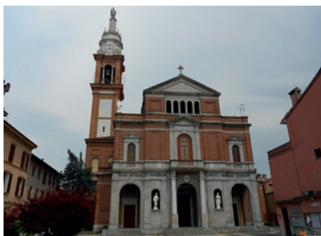
BASILICA S. FRANCESCA CABRINI · S. ANGELO LOD.