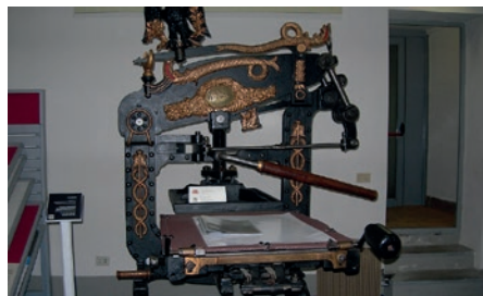
MUSEO DELLA STAMPA E STAMPA D'ARTE