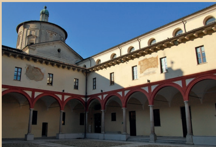
EX CONVENTO DI S. CRISTOFORO (ATTUALE SEDE DELLA PROVINCIA DI LODI)