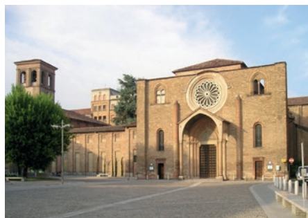
CHIESA DI S. FRANCESCO D'ASSISI