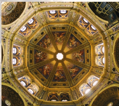
TEMPIO CIVICO DELL'INCORONATA