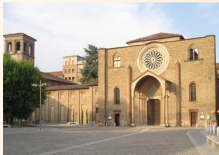
CHIESA DI S. FRANCESCO D'ASSISI