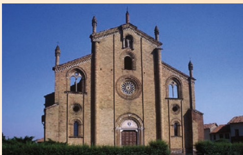
BASILICA DEI XII APOSTOLI - LODI VECCHIO