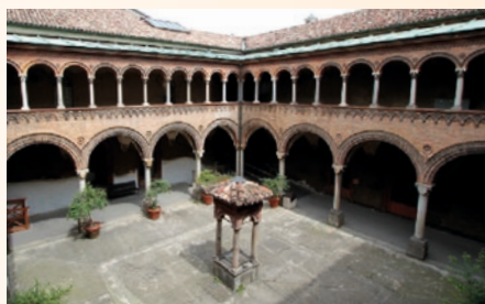
CHIOSTRO DELL'OSPEDALE MAGGIORE