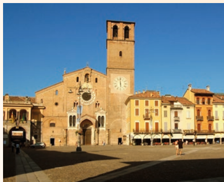
CATTEDRALE · S. MARIA ASSUNTA