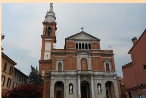
BASILICA S. FRANCESCA CABRINI - S. ANGELO LOD.