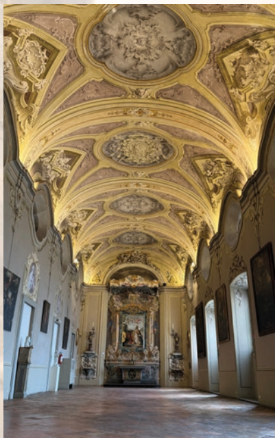
MUSEO DIOCESANO CAPPELLA PALATINA