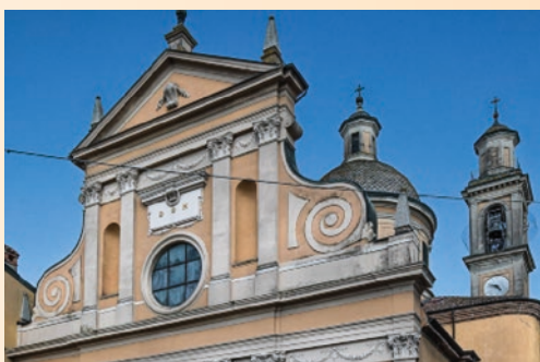
CHIESA SS. PIETRO PAOLO E COLOMBANO - FOMBIO