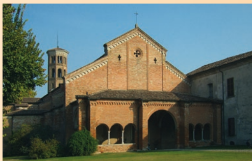
ABBAZIA CISTERCENSE - ABBADIA CERRETO